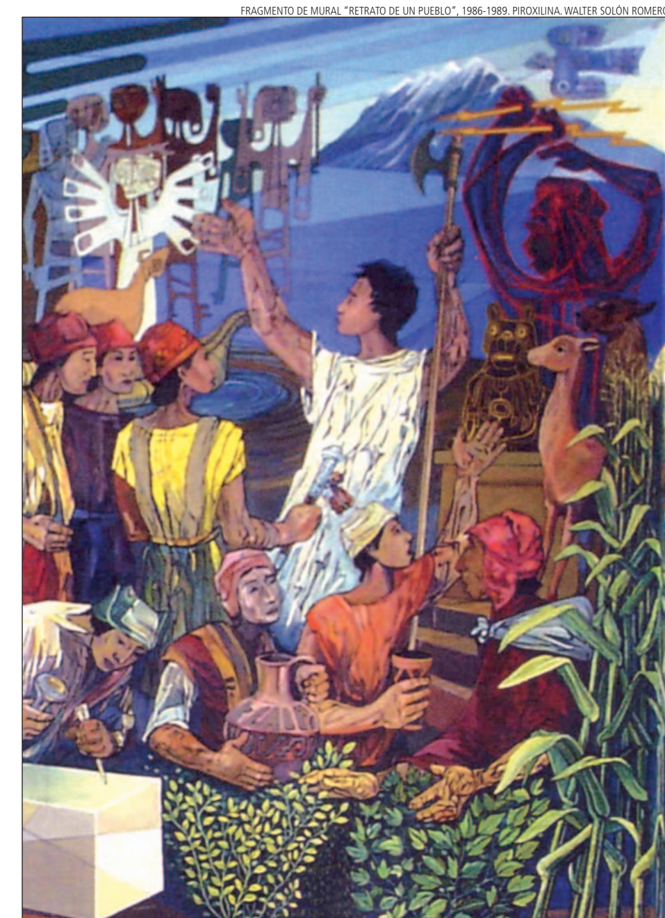
FRAGMENTO DE MURAL "RETRATO DE UN PUEBLO", 1986-1989. PIROXILINA, WALTER SOLÓN ROMERO.

* DIRECTOR EJECUTIVO DE SOUTH CENTRE, UNA ORGANIZACIÓN DE PAÍSES EN DESARROLLO CON SEDE EN GINEBRA.