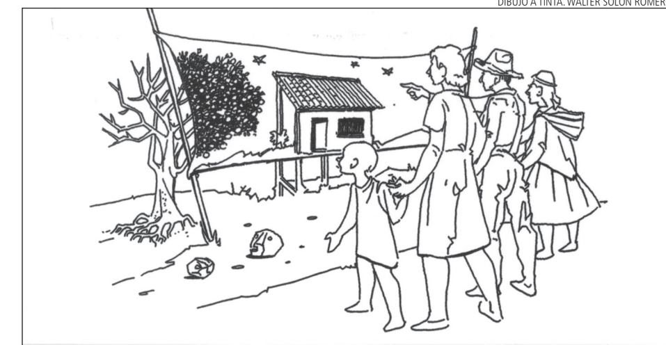
DIBUJO A TINTA, WALTER SOLÓN ROMERO.