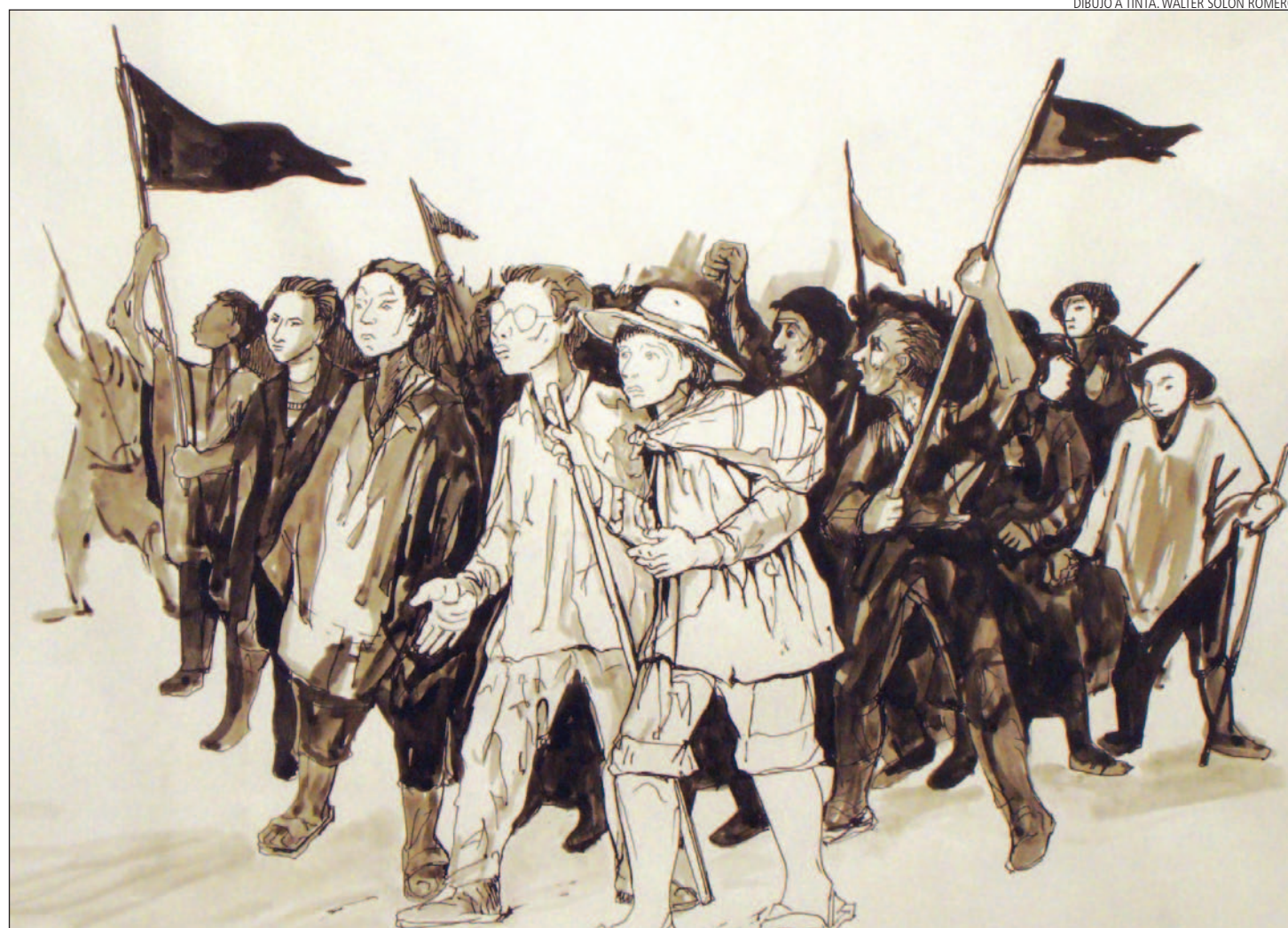
DIBUJO A TINTA, WALTER SOLÓN ROMERO

* Financiamiento, tecnología y creación de capacidad: financiamiento a largo plazo; creación de un nuevo fondo; acuerdos para mejorar la coherencia y coordinación en el financiamiento para el cambio climático.