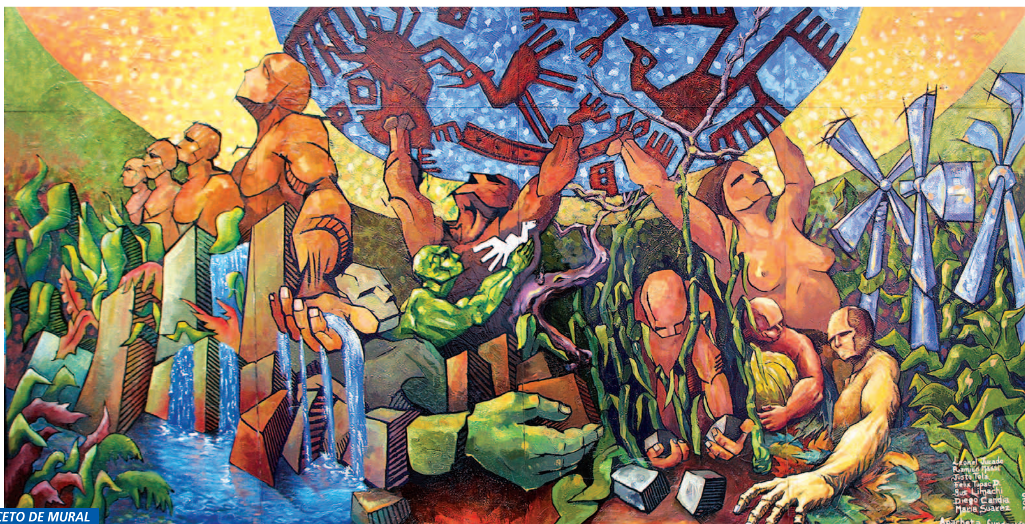
BOCETO DE MURAL