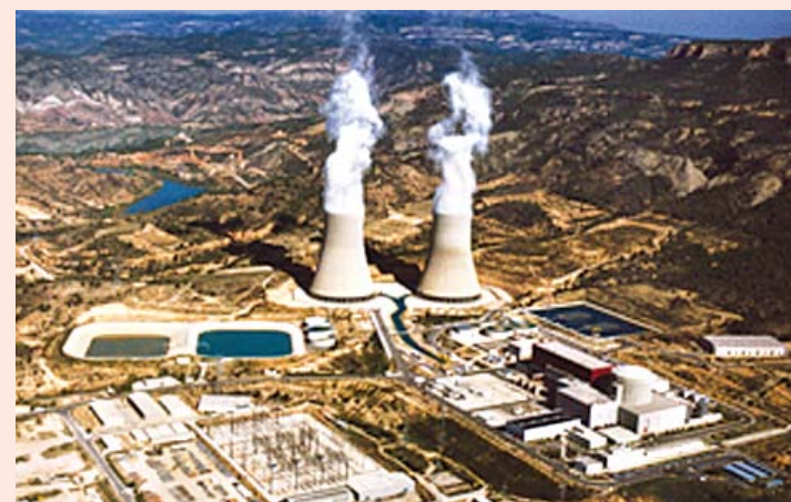
Central nuclear de Cofrentes.

* Responsable de Energía de Greenpeace España