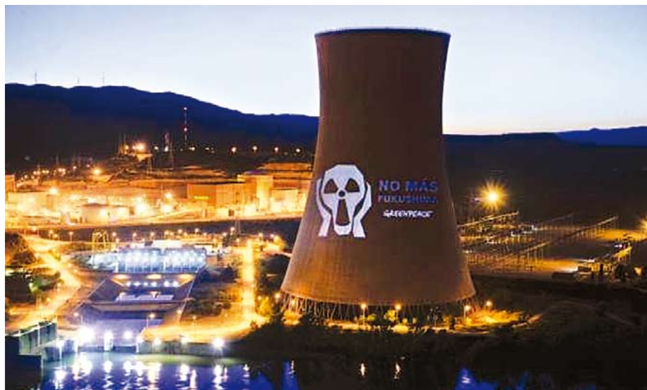
Greenpeace proyectó en la chimenea de la central nuclear española de Ascó la imagen de una calavera con la leyenda "No más Fukushima".

está reconocido que el riesgo de la radiación para los niños es mayor que para los adultos.