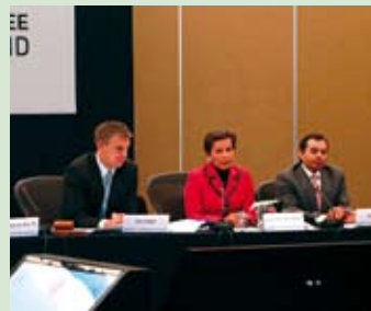
Presentación del Fondo Verde en México.

El organismo debe impulsar acciones de mitigación y adaptación de los países en desarrollo en base a modelos tecnológicos y sociales que les