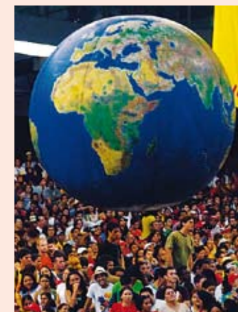
Informe del Comité Facilitador de la Sociedad Civil Brasileña para Río+20

Este informe se basa en datos de South-North Development Monitor (SUNS), Servicio Informativo del ISD, Third World Network (TWN), Preocupaciones de la sociedad civil sobre la posición de la Unión Europea hacia Río+20.