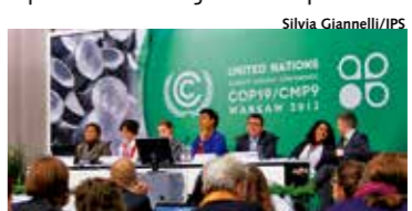
Taller sobre Género y Cambio Climático en Varsovia