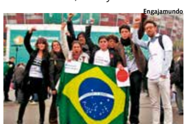
Jóvenes brasileños en la COP 19.

Los tres países que se destacaron en temas de género en sus informes nacionales presentados ante las Convenciones de Río sobre biodiversidad, cambio climático y diversificación, y ante la Convención sobre la Eliminación de Todas las Formas de Discriminación contra la Mujer, fueron en este orden India, Kenia y Ghana.